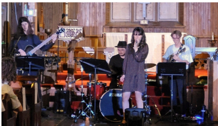
Les artistes étudiants en pleine performance de jazz. Photo : Katherine Archer, mai 2024.